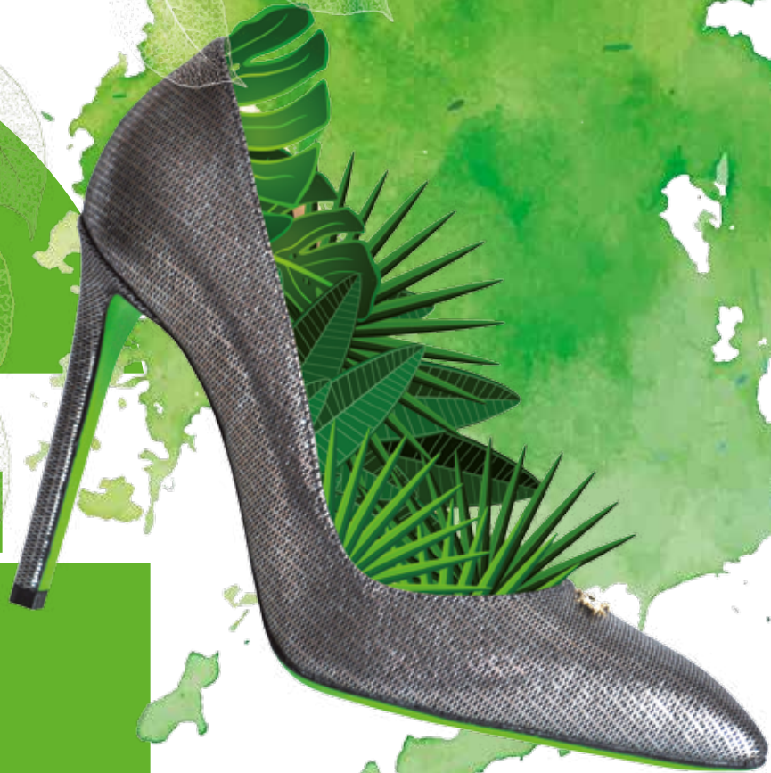
Pumps mit grün leuchtender Sohle, von La Martina

IST DER MEGATREND FÜR LIFESTYLE UND INTERIOR