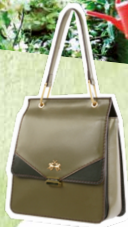
La Martina, Grün wirkt

Grün besticht durch zahlreiche Nuancen, kann viele Gesichter und damit unterschiedliche Effekte haben. Neongrün kommt in der Mode aktuell wieder zum Einsatz, aber sicherlich nicht zu Hause als Wandfarbe. Hier eignen sich mildere Töne und harmonische Abmischungen. Ob Mode oder Interior-Bereich – beide haben gemeinsam, dass ein grüner Akzent immer ein Wow-Effekt ist.